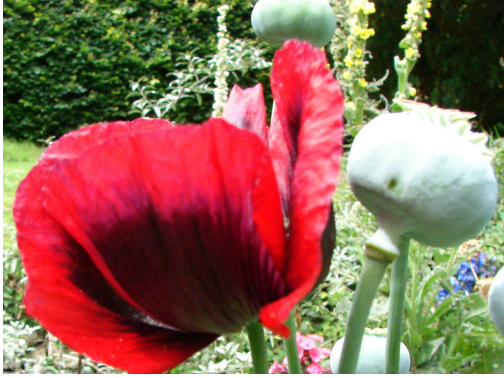
The Chalice Well